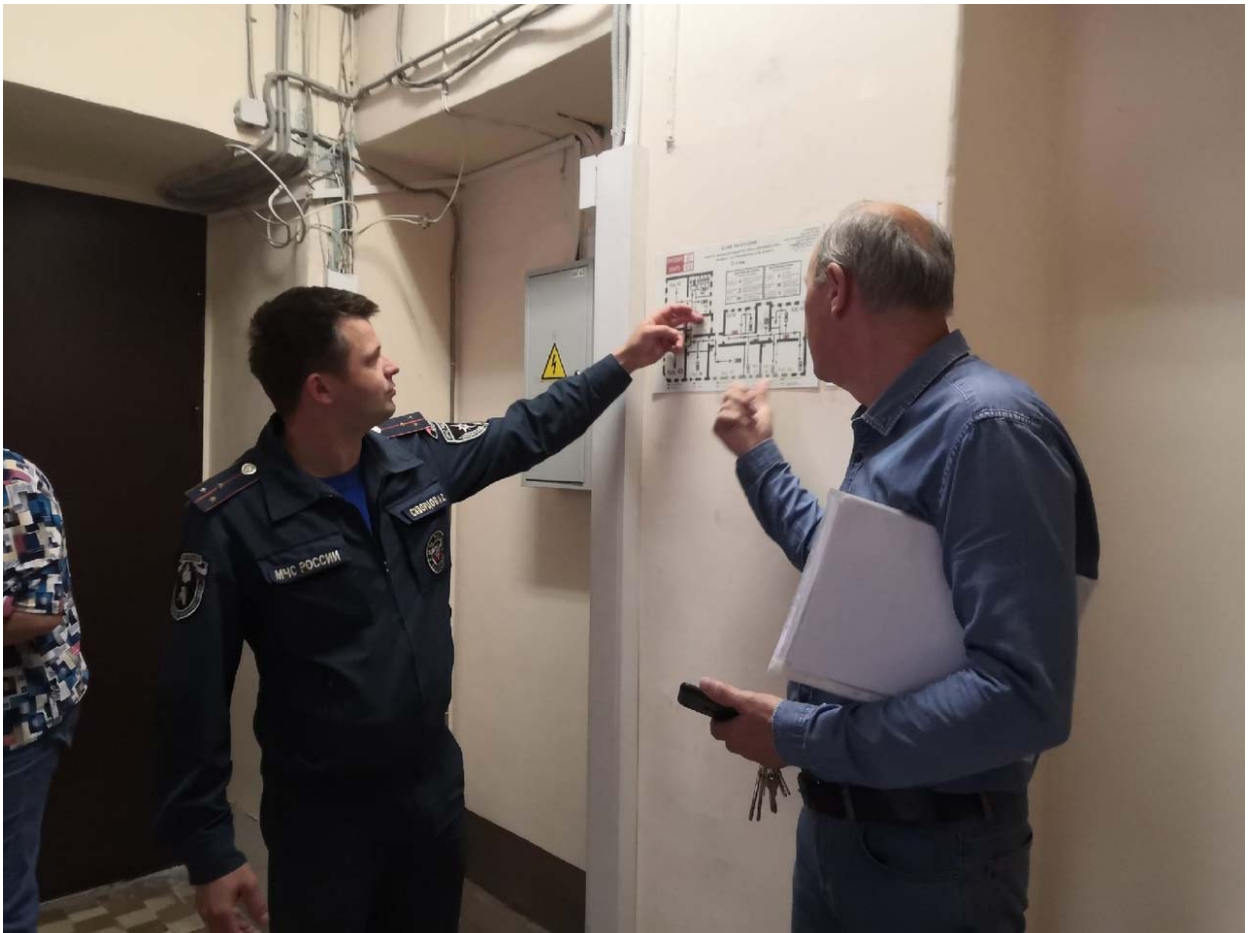
Управление по Центральному району 20.07.2020