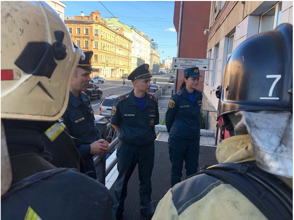
Управление по Центральному району 25.08.2020