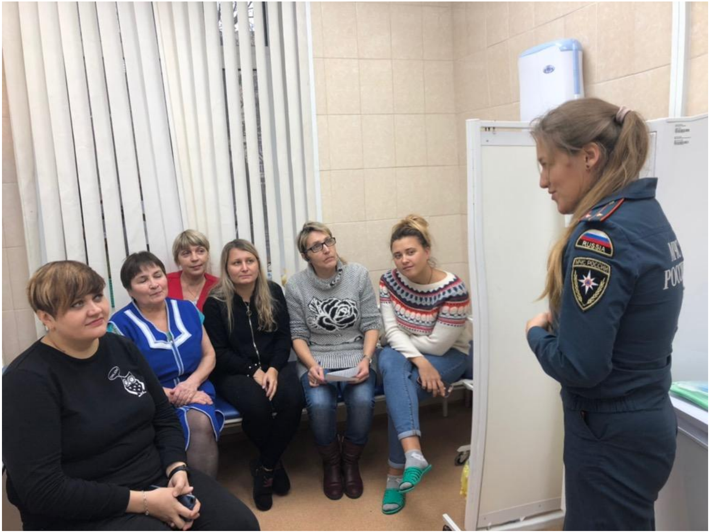
ОНДПР Центрального района 23.11.2018г.