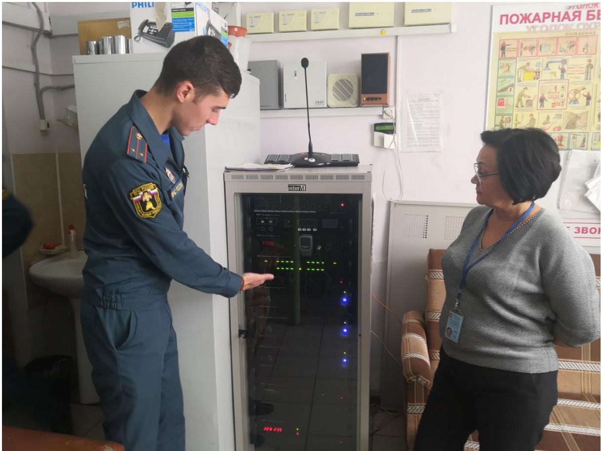
ОНДПР Центрального района 18.10.2019