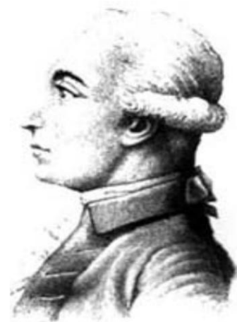
Луи-Клод де Сен-Мартен (1743-1803)

Месмеризм наследовал в истории французской эзотерики мартинизму – доктрине ученика Мартинеса де Паскуали (1727?-1774) Луи Клода де Сен-Мартена (1743-1803), также повлиявшей на Леви, о человеке как «универсальном шифре» всего живого, «главном министре божества», способном объединить в себе мир и воскресить его, обратившись к Творцу 10 . Идея мира