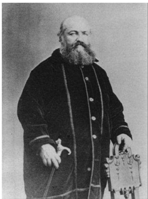
Элифас Леви (1810-1875)

...many a quaint and curious volume of forgotten lore... E. A. Poe