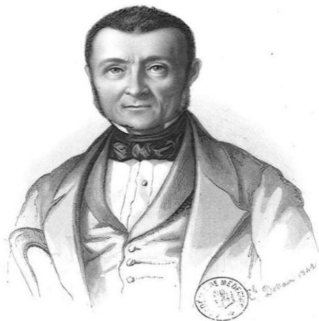
M r LE BARON DUPOTET.

«Итак, есть огонь, свет, который не есть обычный огонь или свет <...> но все доказывает его идентичность с самим принципом, который служит во все времена, чтобы совершать удивительные дела (pour opérer des oeuvres merveilleuses), доказательства этому есть в изобилии» 88 .